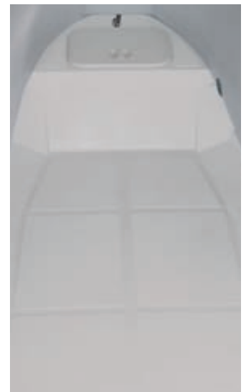
Flacher Boden für Annexe Pri310H-FF und Pri350H-FF.