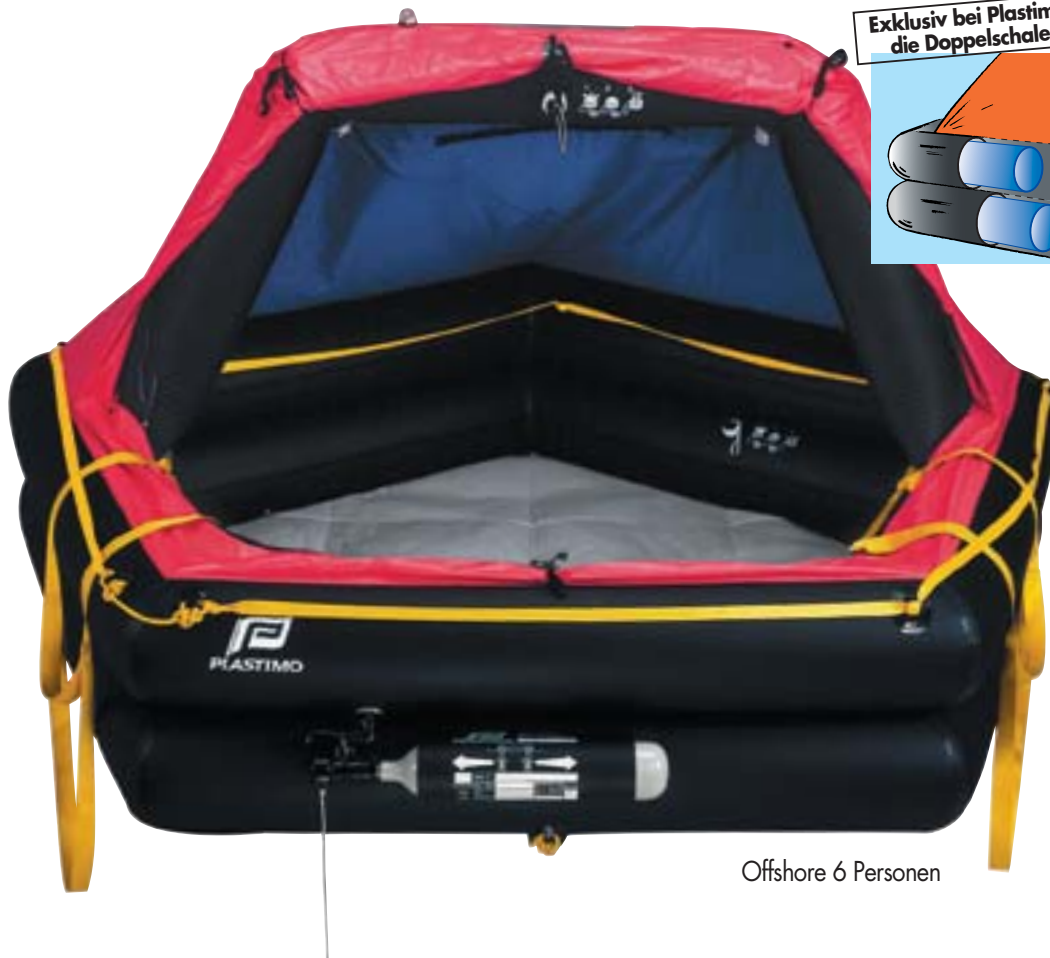
Offshore 6 Personen

Exklusiv bei Plastimo : die Doppelschalen